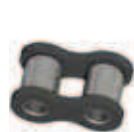
No. 4 (B)