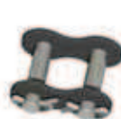
No. 111 (S)