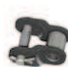
No. 12 (L)