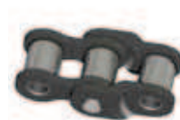
No. 15 (C)