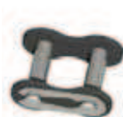
No. 11 (E)