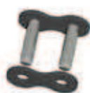
No. 7 (A)